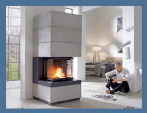
Wohn-Wärme Mit Öfen und Kaminanlagen genussvoll heizen

Der Sieger: Neues Leben für alte Mühle Sanierungspreis 14